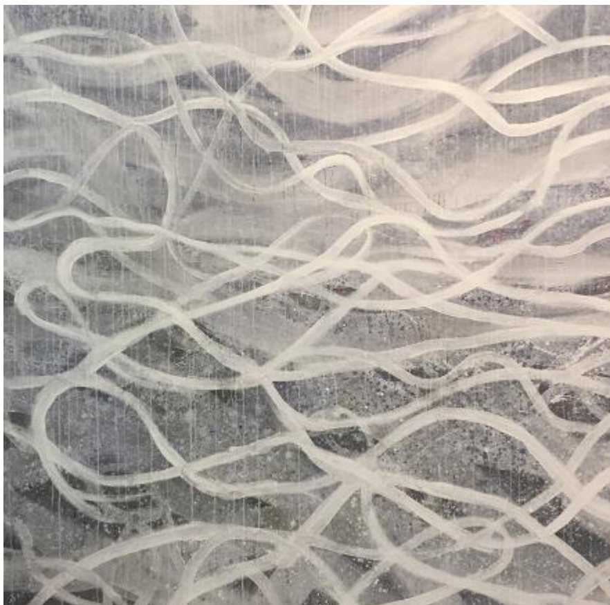
Silvana Solivella, Sans titre , technique mixte sur toile, 160x160 cm, 2016