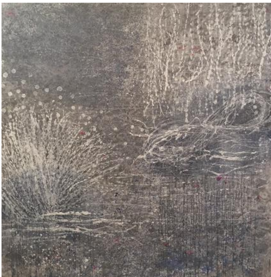
Silvana Solivella, Sans titre , technique mixte sur toile, 200 x 200 cm, 2017