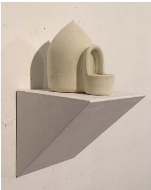
Silvana Solivella, Salmaya , poterie, terre et sel, 15 x 15 x 15 (3 x 8 pièces) 2017