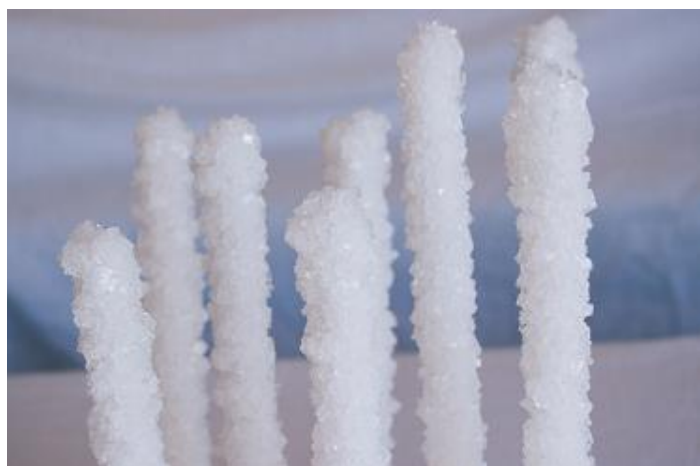
Silvana Solivella, De sal y de viento , végétaux et objets salinisés, dimensions variables, 2017