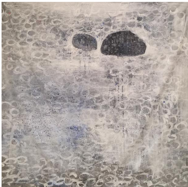
Silvana Solivella, Sans titre , technique mixte sur toile, 150 x 150 cm, 2017