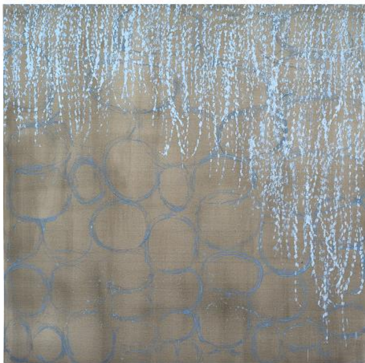
Silvana Solivella, Sans titre , technique mixte sur toile, 160 x 160 cm, 2017