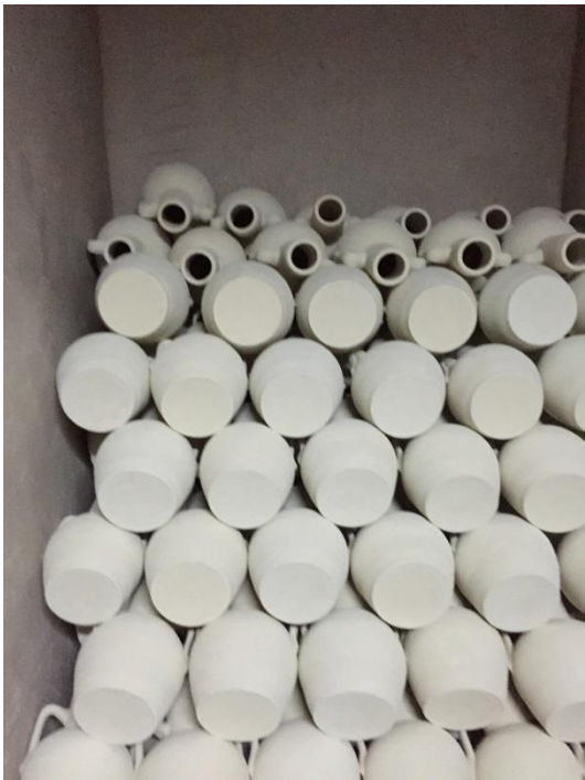
Silvana Solivella, Cueva ou de terre et de sel , poterie, terre et sel, 150 x 150cm, 2017