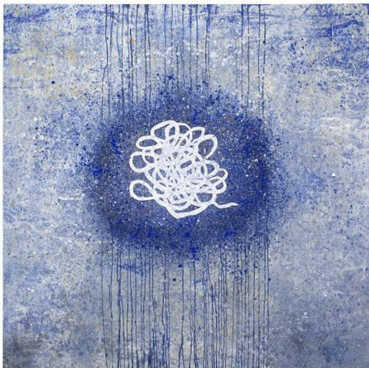
Silvana Solivella, Sans titre , technique mixte sur toile, 160 x 160 cm 2016