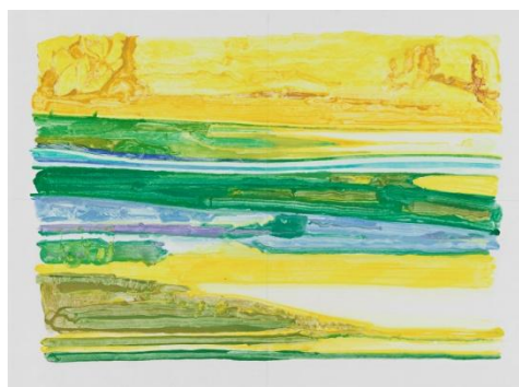
Stéphane Belzère, Monotype N° 4 , peinture à l'huile sur papier de Chine, 46 x 70 cm © S. Belzère-Kreienbühl / ADAGP, photo. Jean Genoud SA / F. Paley