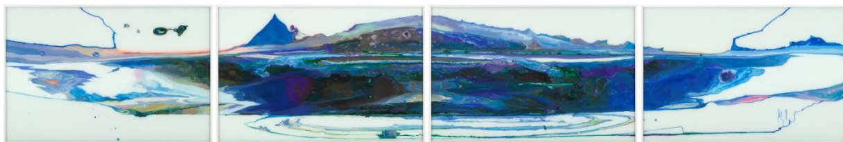
Stéphane Belzère, Fixé-sous-verre N° 3 , peinture acrylique sur verre, 62 x 372 cm © Stéphane Belzère-Kreienbühl / ADAGP