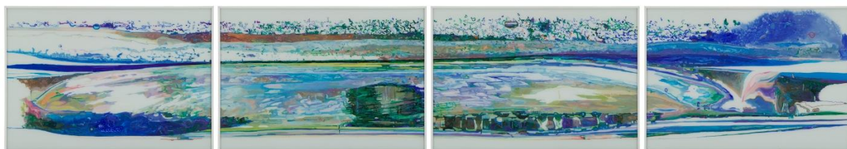
Stéphane Belzère, Fixé-sous-verre N° 2 , peinture acrylique sur verre, 70 x 140 cm © Stéphane Belzère-Kreienbühl / ADAGP, photo. Jean Genoud SA / F. Paley