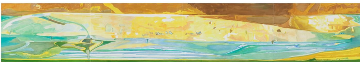
Stéphane Belzère, Grand tableau long N° 7 , peinture acrylique sur toile, 120 x 710 cm © Stéphane Belzère-Kreienbühl / ADAGP