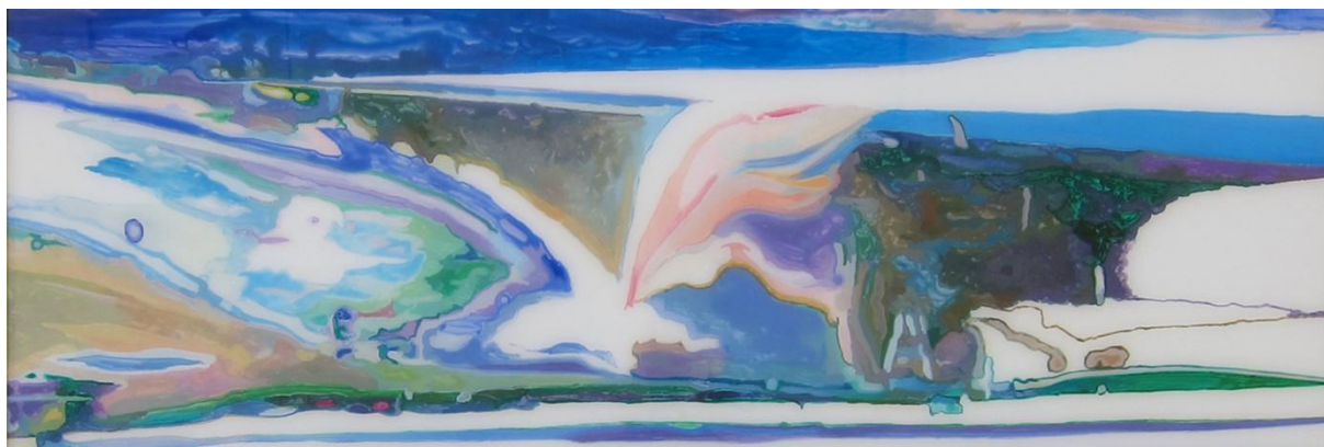
Stéphane Belzère, Fixé-sous-verre N° 2 (détail) , peinture acrylique sur verre, 70 x 400 cm © Stéphane Belzère-Kreienbühl / ADAGP, photo. Jean Genoud SA / F. Paley

Commissaire de l'exposition : Nicolas Raboud