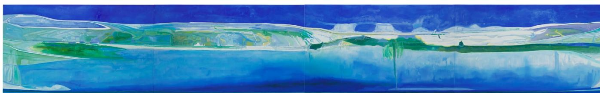
Stéphane Belzère, Grand tableau long N° 6 , peinture à l'huile sur toile, 120 x 800 cm © Stéphane Belzère-Kreienbühl / ADAGP, photo. Jean Genoud SA / F. Paley