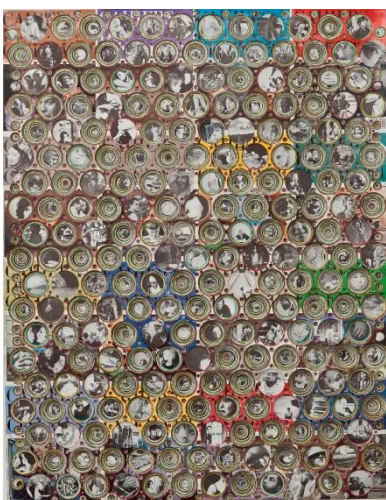
Carmen Perrin Forages, les cahiers d'Alberto (cahiers du cinéma, années 80), 2012. Technique mixte, revues perforées, 108x86x2cm