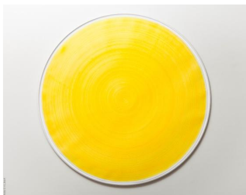
Carmen Perrin, Tracé tourné jaune , 2009, 116x116x4.5 cm