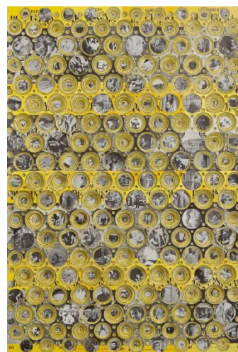
Carmen Perrin Forages, les cahiers d'Alberto (cahiers du cinéma, années 60), 2012. Technique mixte, revues perforées, 108x85x2cm