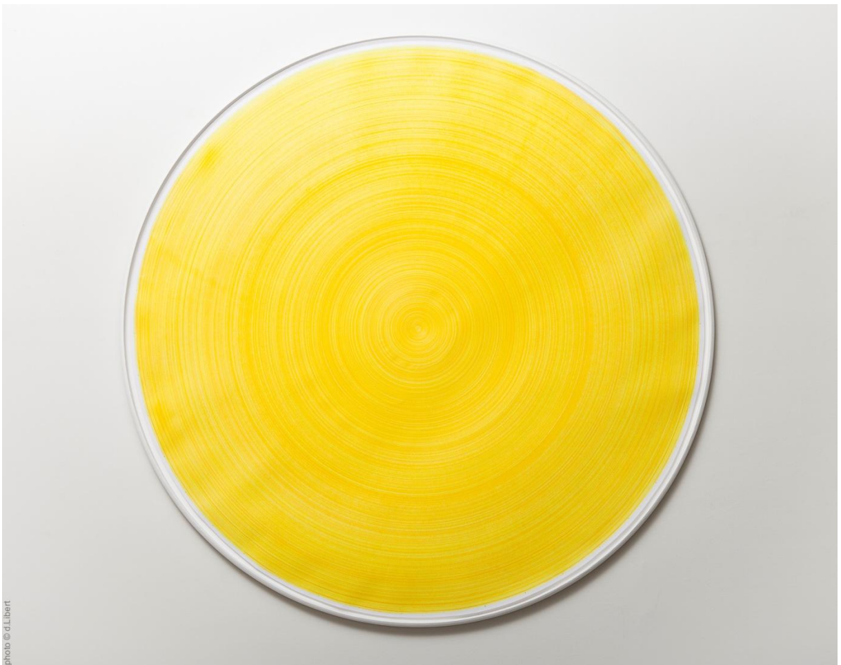
Carmen Perrin, Tracé tourné jaune, 2009, 116x116x4.5 cm

Certaines interventions éphémères qui répondent aux dimensions et qualités des espaces, s'articulent avec ces traces. Les œuvres mobiles ont été choisies comme des contrepoints à ces installations. A travers un vocabulaire plastique distinct et une autre manière d'habiter l'espace d'une salle ou la surface d'un mur, elles soulignent la présence d'un matériau, la singularité d'un phénomène physique (comme la tension), d'un motif sculptural ou d'une couleur. Carmen Perrin