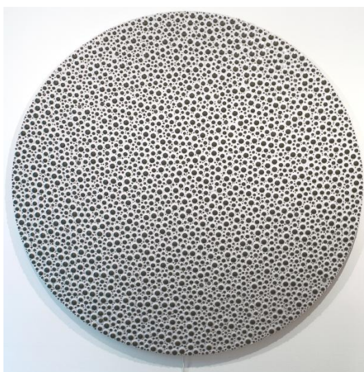
Carmen Perrin, Chutes , yeux en plastique, bois et moteur, 200 x 200 x 3 cm

L'exposition fait la part belle à la perforation, acte récurrent dans l'élaboration de son œuvre, et prolonge ses explorations en relation avec l'espace public, en proposant notamment des installations pour la première fois présentées en Suisse.