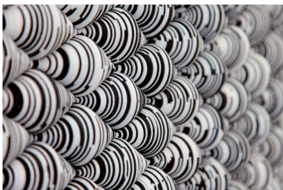
Carmen Perrin, Captures 2012 (détail), noir blanc, technique mixte, caoutchouc mousse perforé, 65,5 x123, 5x10cm © DR