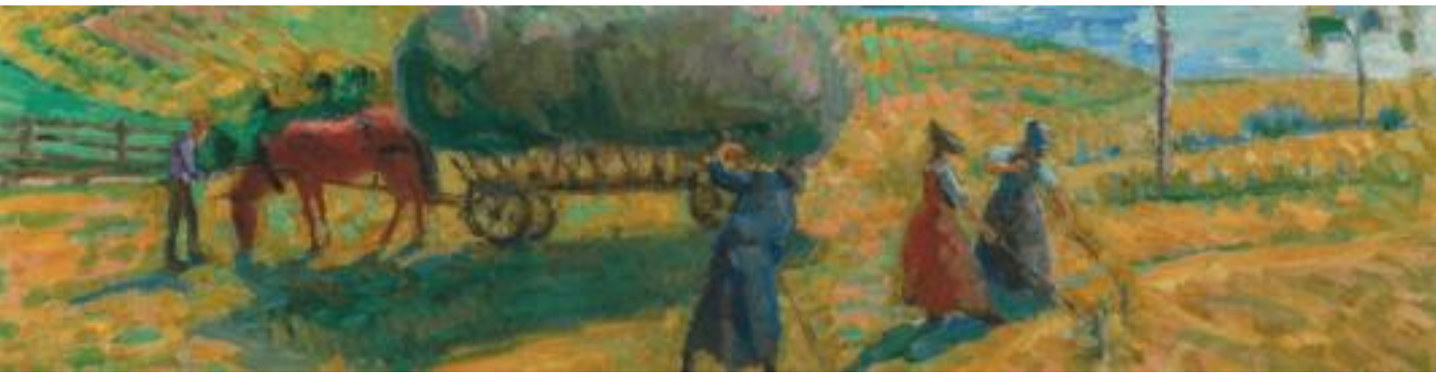
Albert Muret, Les foins (détail), 1916, huile sur toile

Commissaire de l'exposition: Bernard Wyder