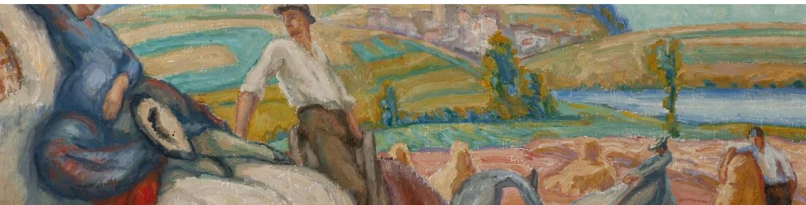
Albert Muret, Les quatre saisons. L'été (détail), 1918, huile sur toile