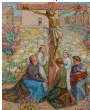
Le crucifix , huile sur toile, 1907 © Commune de Lens, photo. R. Hofer