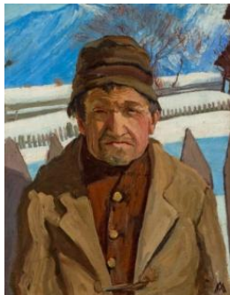
Portrait de Cyrille Bonvin , huile sur toile, 1902

L'utilisation des visuels est limitée à la promotion de l'exposition. La mention du copyright est obligatoire.