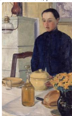
Ludvine , huile sur toile, 1903 © Neuchâtel, Musée d'Art et d'Histoire, photo. S. Iori