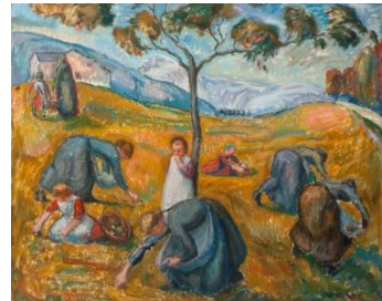
Les quatre saisons. L'automne , huile sur toile, 1918