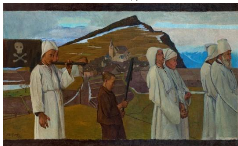
L'enterrement , huile sur toile, 1904