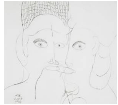
Baiser, 1976, huile sur toile