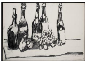
Cinq bouteilles et fruits , vers 1956, crayon gras sur papier fort