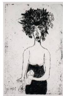
« Jeune fille à la fleur », 1964, eau-forte et aquatinte, © Fondation Jacqueline Oyex, photo. C. Bornand