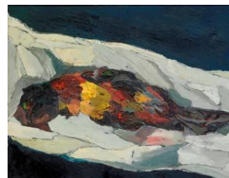
Oiseau sur un linge , 1955, huile sur toile © Fondation Jacqueline Oyex, photo. C. Bornand