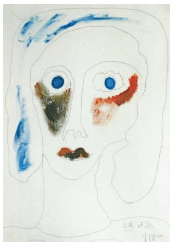
Autoportrait, vers 1995, huile et crayon sur toile

Une monographie de Michel Thévoz, professeur honoraire à l'Université de Lausanne, et ancien directeur de la Collection de l'Art Brut, permet de prolonger la visite et de découvrir une vie et une œuvre intimement liées dans la fragilité et la force de l'imaginaire.