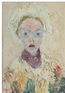
Autoportrait , 1962, huile sur toile