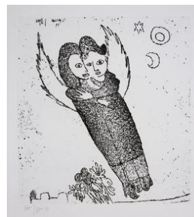
« Année 77 Anges », 1977, eau-forte et aquatinte © Fondation Jacqueline Oyex, photo. C. Bornand