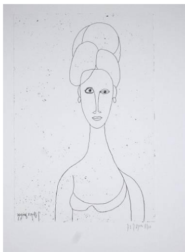
« Jeune femme aux traits », 1973, eau forte