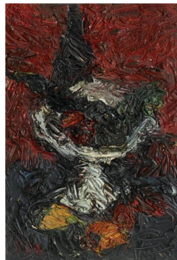
Coupe de fruits , vers 1958, huile sur toile

Peinture /// La peinture a ainsi fréquemment pour sujet le portrait, mais l'autre sujet de prédilection est la nature morte. La matière, d'abord déposée en couches épaisses finit par être tracée au doigt selon une technique empruntée vraisemblablement à Louis Soutter. Jacqueline Oyex ne présentait que rarement ses toiles, préférant les offrir à ses proches plutôt qu'au regard du public.