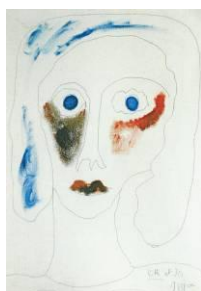
Autoportrait , vers 1995, huile et crayon sur toile © Fondation Jacqueline Oyex, photo. C. Bornand