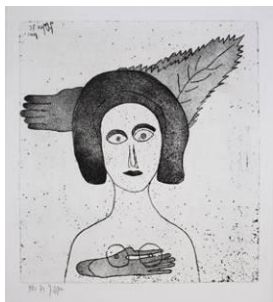
« Grande femme à la feuille », 1975, eau-forte et aquatinte © Fondation Jacqueline Oyex, photo. C. Bornand

L'utilisation des visuels est limitée à la promotion de l'exposition. La mention du copyright est obligatoire.