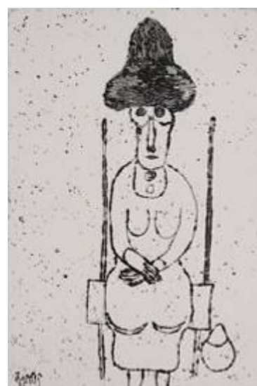
« Femme assise année 74 », 1974, eau-forte © Fondation Jacqueline Oyex, photo. C. Bornand