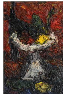
Coupe de fruits , ca. 1958, huile sur toile © Fondation Jacqueline Oyex, photo. C. Bornand