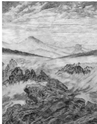
44. sans titre, 2003 © Didier Rittener