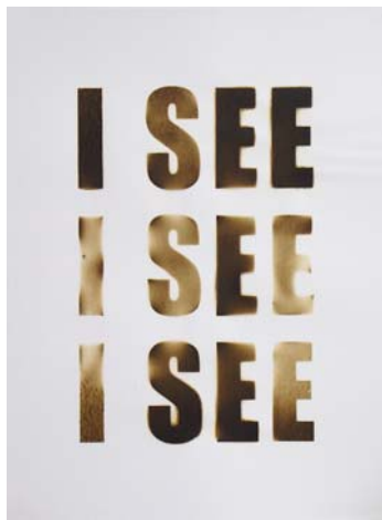
30. I see, I see, I see, 2007 © Didier Rittener