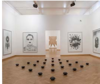
14. Danger Zone, 2003 © Virginie Otth, Musée Cantonal des Beaux-arts de Lausanne, 2005