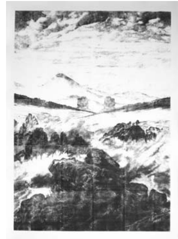
23. Double pitons rocheux, 2006 © Didier Rittener