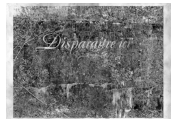
49. Disparaître ici, 2007 © Didier Rittener